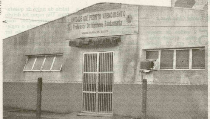
Disponível na conta vinculada ao Guarujá, mais de R$ 3 milhões seriam destinados para reforma e ampliação do equipamento de saúde